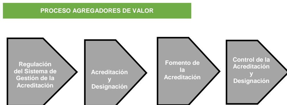
Gráfica N°1: Cadena de Valor Institucional

Elaborado por: Unidad de Planificación