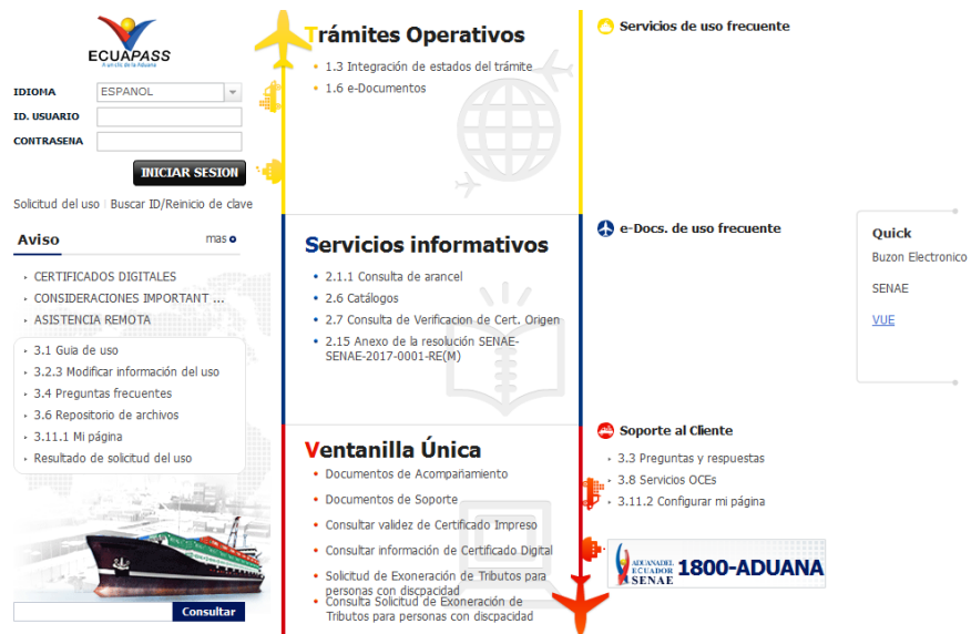
Gráfico N° 1: Sistema ECUAPASS – Pantalla inicial