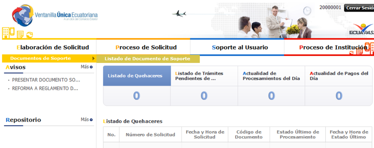
Gráfico N° 2: Sistema ECUAPASS – Ingreso