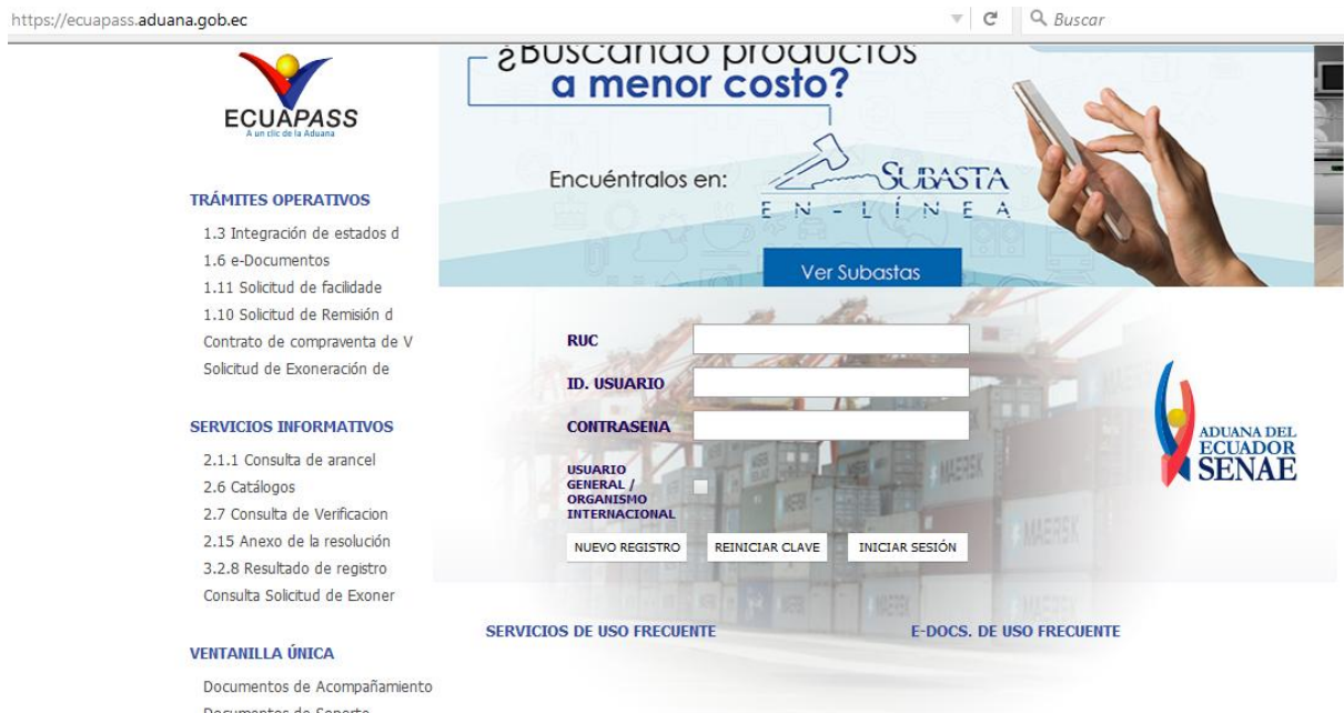
Gráfico N° 1: Sistema ECUAPASS – Pantalla inicial